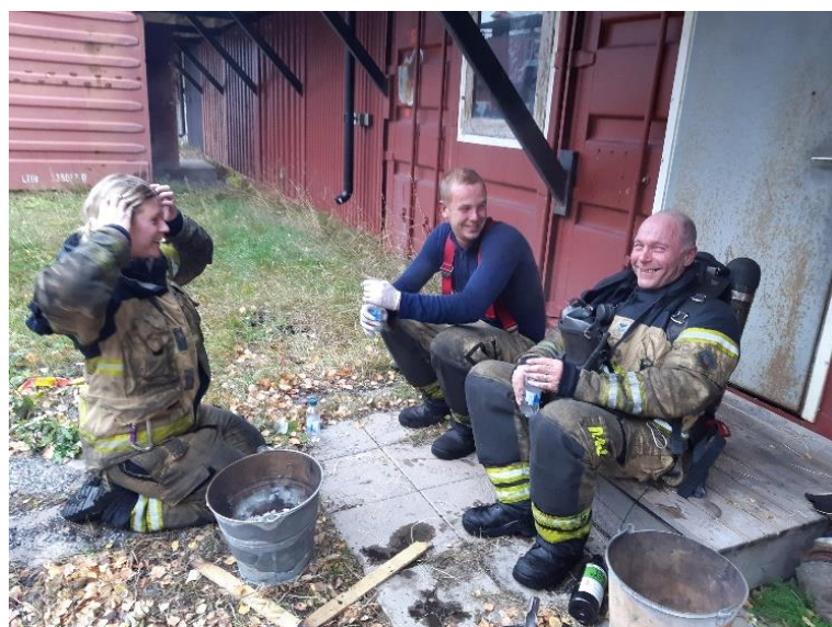
Bild 2: Vila efter obligatorisk rökdykningsövning för RiB-personal

Förbundet är inte exponerat för finansiella risker såsom ränterisker, valutarisker och kreditrisker och kommer därför ej lämna några upplysningar om omfattning och hantering av dessa typer av risker.