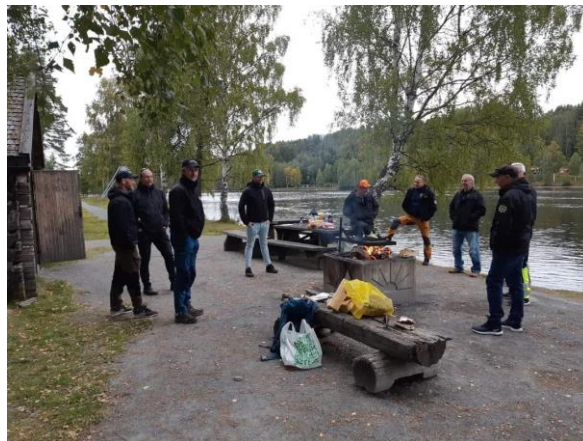
Bild 3: Tack vare rådande omständigheter och restriktioner har vissa möten hållits utomhus. Här träff med stationsansvariga inom RIB-verksamheten.

Under året har räddningstjänsten på olika sätt stöttat kommunerna i deras hantering av pandemin, dels har organisationen varit representerad i krisledningen, dels har räddningstjänsten stöttat kommunerna med hantering av skyddsutrustning och handsprit.